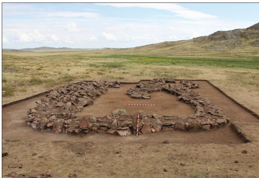
Рис. 3. Жилище на поселении Тагыбайбулак (фото)

ды 2, к. 5 (рис. 2: 5, 6), близки бронзовые ножи из Кособы и Едирей 3 (рис. 2: 11, 12), пробойники из Карашоки и Акбеит (рис. 2: 13, 14).